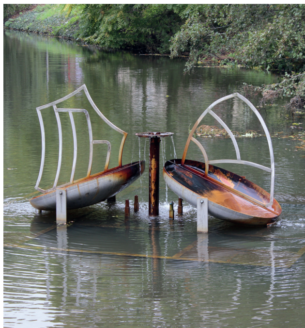
Het Bronmonument

Onder de Kalkoenstraat bevindt zich een natuurlijke waterbron. Een pijp gaat er 25 meter diep de aarde in naar een eeuwenoud waterreservoir.