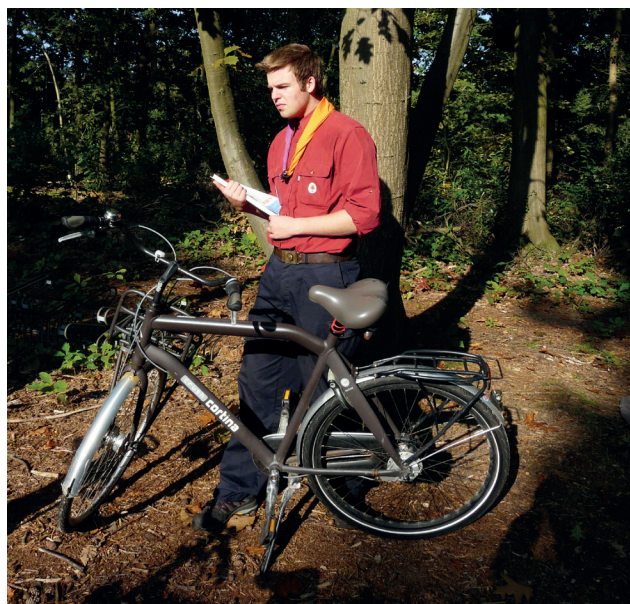
Met de fiets de wijkkrant bezorgen

De welpen zijn jongens van 7 tot en met 11 jaar, de verkenners zijn 12 tot en met 15 jaar, de rowans 16 tot en met 18 jaar en 18 jaar en ouder is de stam. Daarnaast zijn er ook plusscouts. Deze groep is 18 jaar of ouder en is meer ondersteunend aan de groepsleiding en komt zo'n vijf keer per jaar samen.