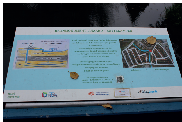
Uitleg van het monument

Amersfoort heeft veel meer van zulke natuurlijke artesische bronnen, onder andere op De Hof. Regenwater van de Veluwe stroomt in een zandlaag tussen twee ondoorlaatbare kleilagen in de richting van de stad. Vroeger werden die bronnen door huishoudens in de stad aangeboord en ook de bierbrouwerijen profiteerden ervan.