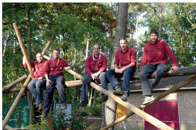
De rowans van Impeesa

Als ik op een zonnige zaterdagmiddag kom kennismaken zijn ze in de kampvuurkuil bezig met het maken van een Zweedse fakkel die ze gaan aansteken met staalwol en batterijen. Boven het vuurtje roosteren ze net geogste tamme kastanjes. Achter het