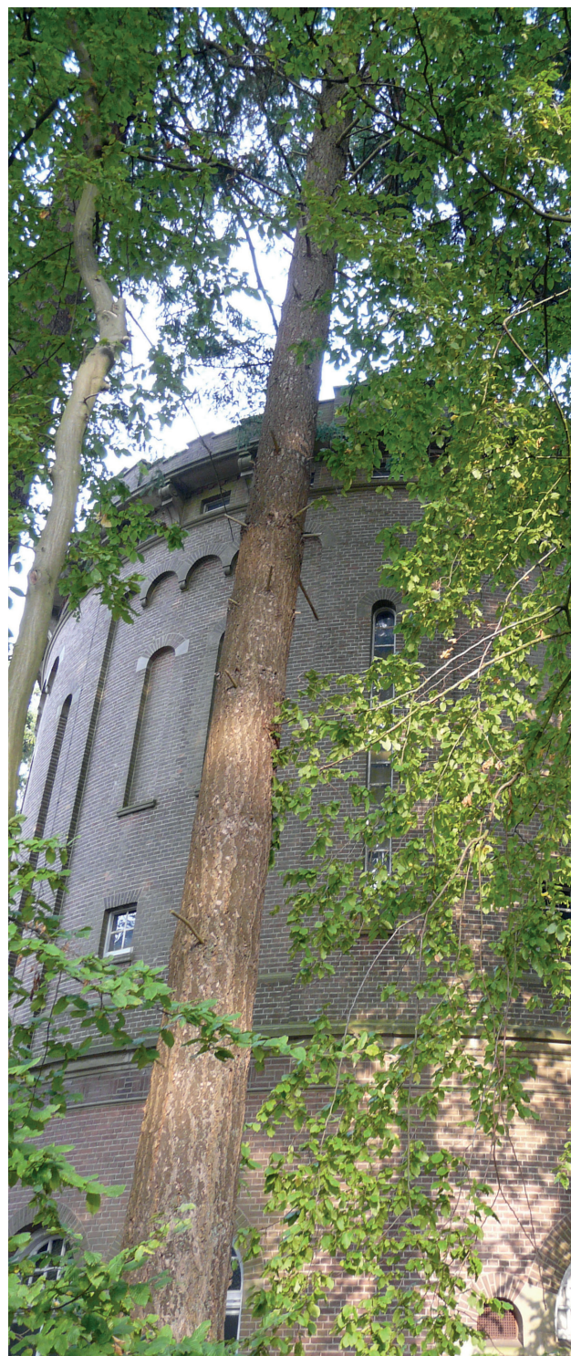
De oude watertoren