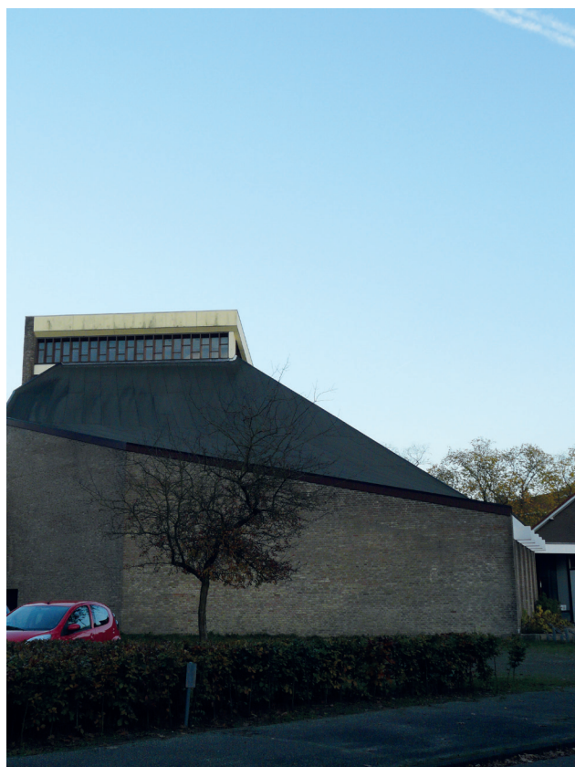
De Fonteinkerk (foto's Renske Pruijt)

In Amersfoort zijn dit jaar meerdere van dit soort festivals te bezoeken. De versie in de Fonteinkerk valt op, niet alleen omdat dit festival onderdeel is van de concertreeks 'Muziek & Ontmoeting', maar ook de muziek is nét even anders. Tijdens het concert komen twee muzikale thema's aan bod. Het eerste thema is Amerikaanse Shakermuziek. De Shakers vormden een leefgemeenschap, waarbij eenvoud en zuiverheid centraal stonden. Dit is terug te horen in hun muziek.