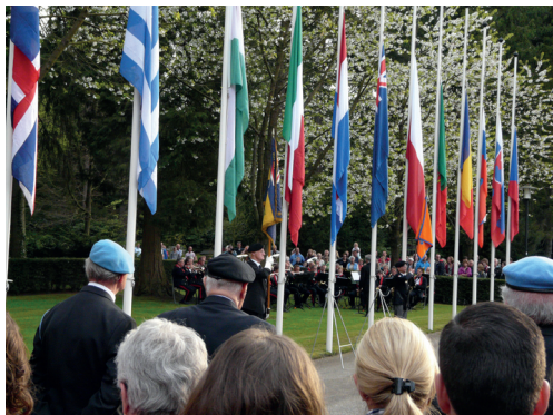
Trompettist speelt 'The Last Post'

Iedereen liep rustig naar de begraafplaats. We kwamen langs De Ladder. Ook een monument. Bij de begraafplaats aange-