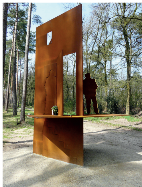
Monument voor schuilplaatsverleners