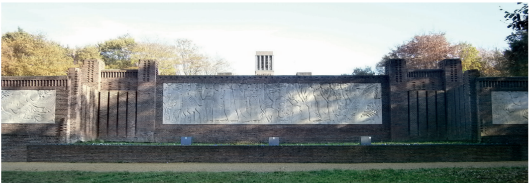
Belgenmonument: muur met kunstwerken

Als teken van dankbaarheid aan het Nederlandse volk boden de Belgen aan een monument te bouwen. Op 10 oktober 1916 ging de gemeenteraad hiermee