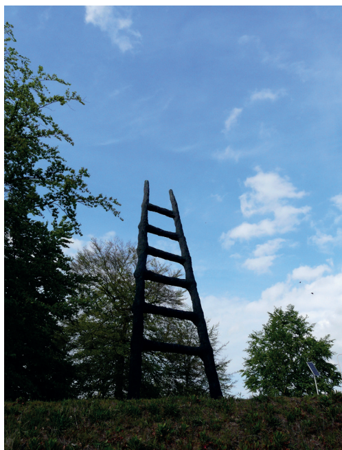
De Ladder