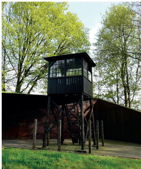
Wachttoeren voor de ingang van het bezoekerscentrum

Dit monument staat aan het einde van de 350 meter lange schietbaan en is in 1953