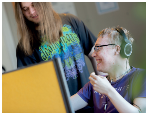
Medewerkers MEO bewijzen hun meerwaarde

“Hiermee stellen wij onze maatschappelijke missie voorop bij alles dat we doen. Wij bieden non-profitorganisaties, zoals wijk-, patiënt- en sportverenigingen de mogelijkheid om voordelig hun commu-