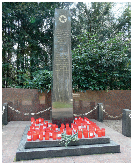
Het Russisch Monument op 7 april 2015

levend propagandamateriaal naar Amersfoort waren vervoerd. Het was de bedoeling de Nederlanders te overtuigen dat de Duitsers ze beschermd hadden tegen de 'Untermenschen'. De gevangenen waren echter zo uitgehongerd dat de Amersfoorters medelijden kregen en uit hun huizen kwamen met water en eten. Bijna 24 Russen overleden in de maanden daarna van de honger, de overige 77 werden op 9 april 1942 doodgeschoten. Op de plek waar hun massagraf is gevonden staat het Russisch monument verscholen in