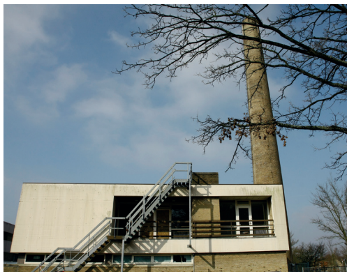
Ketelhuis wordt Parkhuis, foto Bert Vos

De opvallende schoorsteen en het ketelhuis blijven de enige getuigen van de geschiedenis van het ziekenhuis, de grond wordt teruggegeven aan de natuur wanneer de overige gebouwen tegen de vlakte gaan. Het ketelhuis wordt, zegt de woordvoerder van Burgerinitiatief Stichting Elisabeth Groen, straks het Parkhuis genoemd en kan worden gebruikt als uitvalsbasis tussen Park Randenbroek en het Heiligenbergerbeekdal.