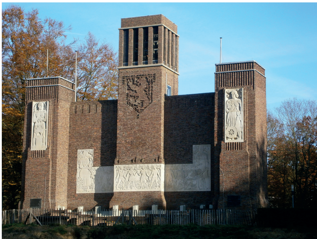
Belgenmonument voorzijde

akkoord. De bouwers waren de militairen van de werkscholen. Het werd een groot monument, in omvang zelfs het grootste van Nederland. Het was gereed in 1919. Omdat de ingang toen aan de Daam Fockemalaan lag, kwam men eerst bij een muur met kunstwerken en daarna bij het hoofdgebouw. De relatie tussen België en Nederland was echter helemaal niet best. Het duurde zelfs tot 22 november 1938 voordat het monument officieel werd geopend. Een jaar later begon de Tweede Wereldoorlog in Europa al!