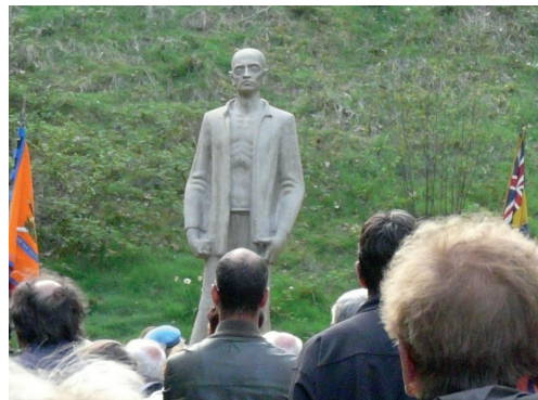
Monument De Stenen Man

komen ging iedereen in een boog om de vlaggen staan. Je hoorde de kerkklok op de achtergrond. Twee oud-soldaten hielden vlaggen vast. Er speelde een orkest, treurige maar toch mooie muziek.