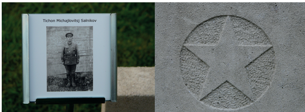
Grafsteen met foto van een Russische soldaat

Ereveld stonden ten tijde van de herdenking op 4 mei 2015 bordjes met foto's van de daar begraven persoon, hierdoor kregen de voornamelijk jonge mannen na ruim 70 jaar eindelijk een gezicht. Sinds 1998 is onderzoeker en journalist Remco Reiding met een speurtocht bezig naar nabestaanden. Inmiddels is de familie van 195 van deze slachtoffers opgespoord.