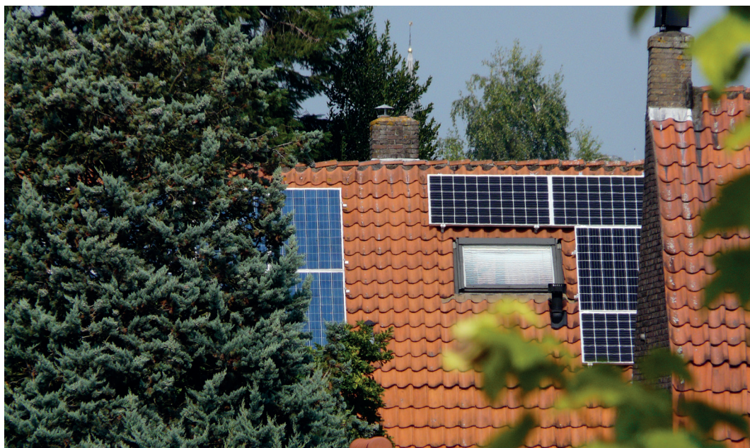
Zonnepanelen op het dak

nieuwe mogelijkheden om zonnepanelen op een fraaiere manier op de eigen woning te plaatsen.