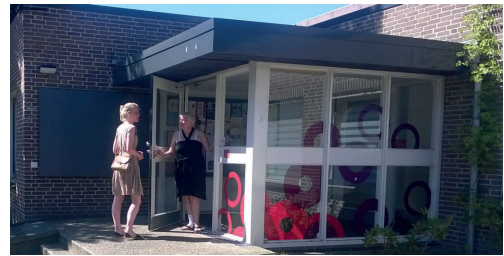
De Driehoek

Veel cliënten van Kwintes vinden niet makkelijk aansluiting bij de samenleving. De wil en de wens is er, en de - figuurlijke - deuren staan vaak nadrukkelijk en uitnodigend open. Maar de praktijk is weerbarstig. Een eerdere poging om een soort inloop voor de wijk op te zetten binnen De Driehoek, was geen succes. Ik denk dat het wel lukt als het een gemeenschappelijk initiatief uit de buurt is, en in een behoefte voorziet. Ik roep bij deze dan ook wijkbewoners op om met je idee naar het Wijkhuis te komen.