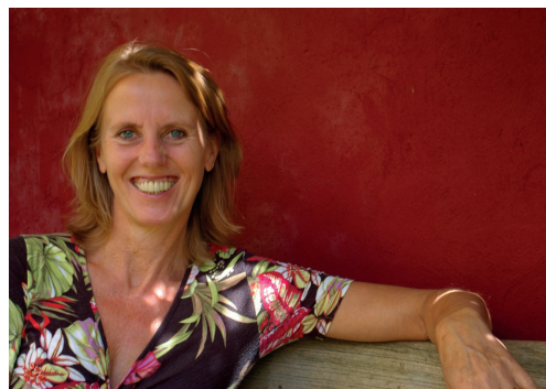
Carin Rijpkema