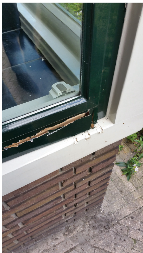
Inbraakschade, foto Politie Amersfoort

De wijkagenten zitten zelf ook in de WhatsApp-groepen. Als het echt alleen over veiligheid gaat, dan doen zij mee. Zij bekijken hoe en wat er gemeld wordt en reageren daarop. Ook adviseren zij de bewoners en geven informatie. Zij denken