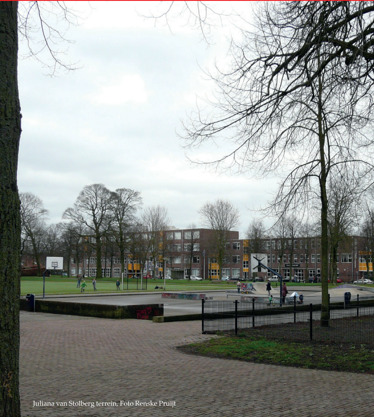
Juliana van Stolberg terrein

Vermeer-, Leusder- en Bergkwartier/Bosgebied, editie lente 2018