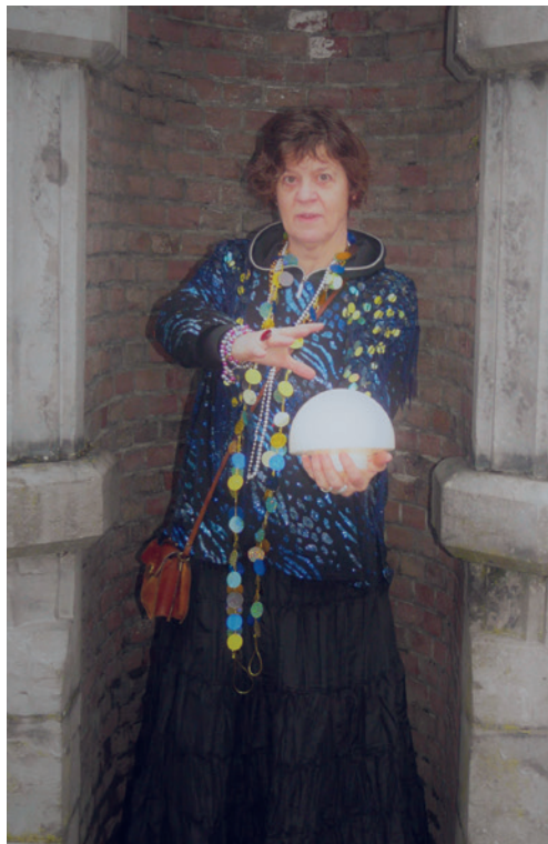
En het weer wordt

De werkgroep Wijkfeest startte met vijf vrijwilligers, maar heeft inmiddels versterking gekregen van onder meer de SRO en de School voor Welzijn, MBO-locatie Leusderweg. Door samenwerking met SRO krijgen sportverenigingen in het zuiden van de stad de mogelijkheid zich te presenteren. De studenten helpen niet alleen mee in de voorbereidingen, maar ook op de dag zelf verlenen ze hand- en spandiensten.