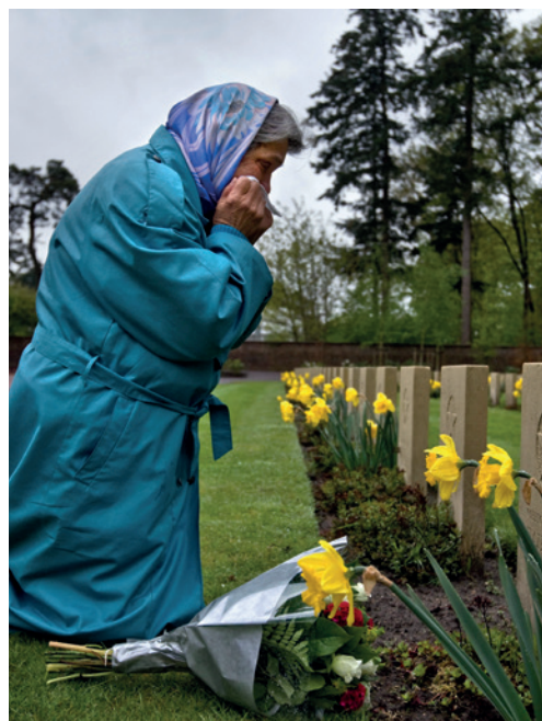
Russisch Ereveld Grafbezoek