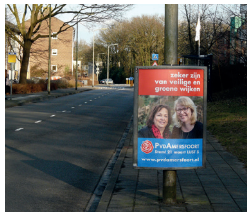
Verkiezingsposter aan de Bosweg