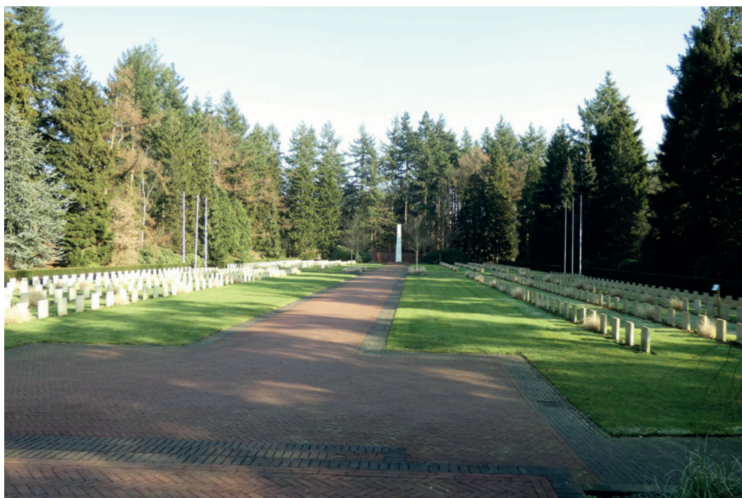
Russisch Ereveld