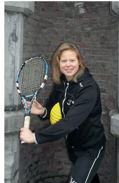
SRO helpt mee