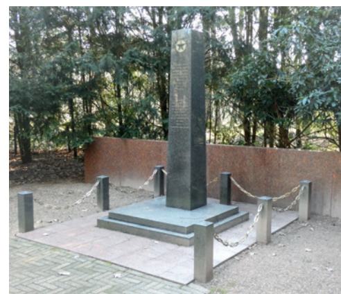
Russisch Monument Koedriest

De behandeling van de Russen is onmenselijk. Ze worden enorm mishandeld, krijgen vreselijk zwaar werk en ook nog eens heel weinig of zelfs dagenlang helemaal niets te eten. Uit pure wanhoop eten ze het pek van de daken en muizen of wormen als ze die kunnen pakken. Als ze op sterven na dood zijn, worden ze opgesloten in een aparte barak, door medegevangenen 'Rusland' genoemd. Van medische hulp is geen sprake, kamparts Van Nieuwenhuysen, nota bene chirurg in De Lichtenberg, trok expres verkeerde kiezen en amputeerde vingers, en dat alles zonder verdoving! 24 stierven er al in het eerste halfjaar.