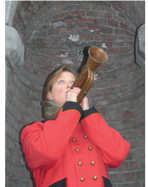
Onze heraut, Foto Renske Pruijt

Intekenen voor deelname aan activiteiten/workshops kan in mei via www.amersfoortzuid.info/wijkfeest . En houdt u daarnaast ook de diverse social media in de gaten, want daarop wordt niet alleen de startdatum voor het intekenen gepubliceerd, ze houden u ook op de hoogte van de nieuwste ontwikkelingen. Zie ook: www.facebook.com/amersfoortzuid.info www.facebook.com/Bewonersinitiatieven-Amersfoort-Zuid